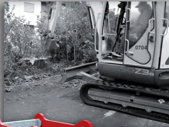
Die Wurzelratte W 6 an einem 5-t-Bagger.