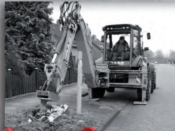
Die Wurzelratte W 12 an einem 8-t-Bagger.