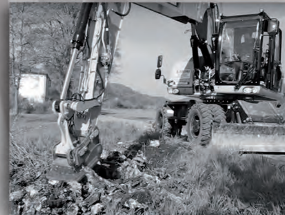
Die Wurzelratte W 20 an einem 16-t-Bagger.