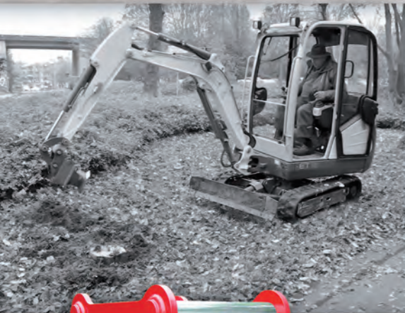
Die Wurzelratte W 2 an einem 1,8-t-Minibagger.